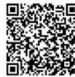
Reservierung von Räumlichkeiten für unsere Gruppen